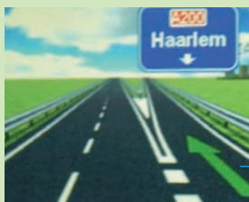
Uit het leven

Het profiel van fragiele X _____ pagina 9